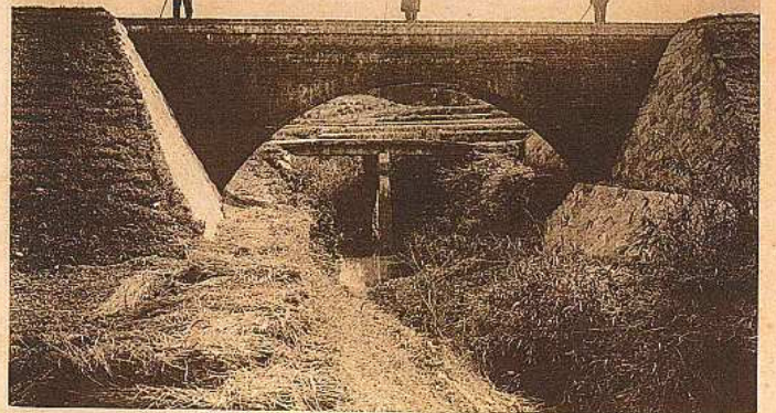
橋道水瓦煉前山徳妙