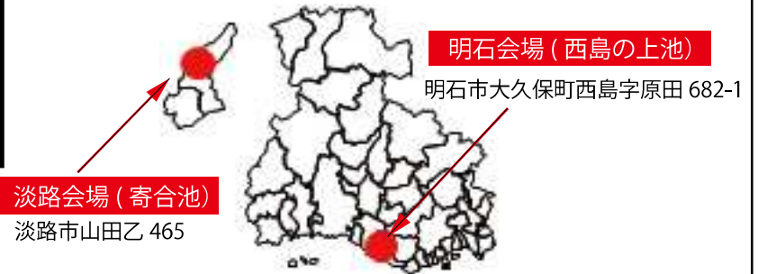
[ため池監視システム展示場]

「ため池監視システム」は、これまで国研究機関のほか民間企業でも開発が進められてきており、水位計の仕組みやスマートフォン等の端末での水位・映像の表示方法が開発者により多種多様です。このような「ため池監視システム」について地域の実情に即して導入を検討していただくため、県内2ヶ所のため池で計3の開発者が水位計等を展示する「ため池監視システム展示場」を開設します。（令和5年12月開設予定）