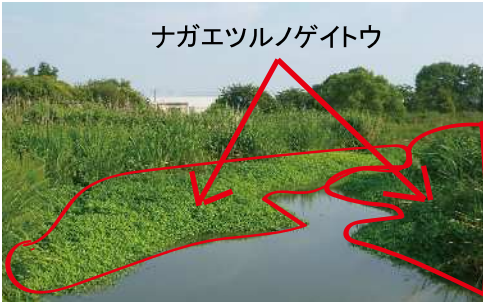
〔ため池内で繁殖したナガエの群落〕

加えて小学生や保護者を対象にため池等の水辺の危険性を注意する取組も行っています。令和5年度は夏休み前に北区、西区の小学校・幼稚園・保育園178校にため池の水難事故防止啓発チラシ4万7千枚を配布しています。