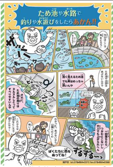
〔水難事故防止啓発チラシ〕

加えて小学生や保護者を対象にため池等の水辺の危険性を注意する取組も行っています。令和5年度は夏休み前に北区、西区の小学校・幼稚園・保育園178校にため池の水難事故防止啓発チラシ4万7千枚を配布しています。