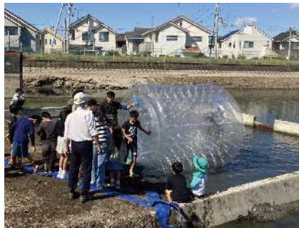
〔ウォーターロール体験〕