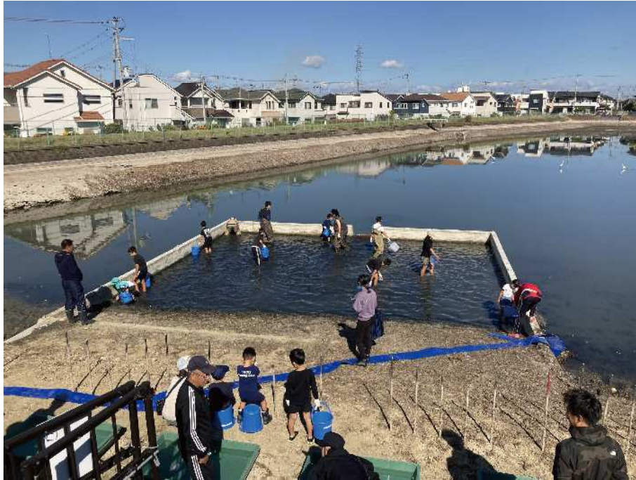
〔魚のつかみどり大会（播磨町 北池）〕

ため池は農業用水を安定的に供給する機能以外に洪水調整、土砂流出防止、生物の生息・生育場所の保全や地域の憩いの場といった多面的な機能を持つ地域の貴重な財産です。その財産を守るため、県内各地でため池クリーンキャンペーンが実施されています。今回は播磨町の北池で行われた活動を紹介いたします。