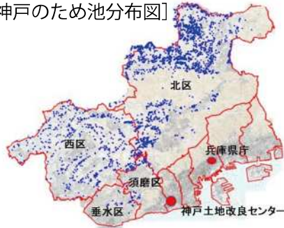
〔神戸のため池分布図〕