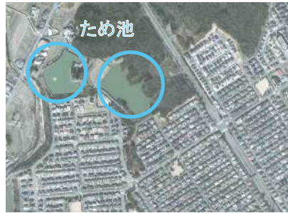
〔住宅地に隣接するため池〕

住宅地に近接しているため池も多く、大規模地震等により、万が一決壊が生じた場合には、大きな被害が発生する恐れがあります。(防災重点農業用ため池632カ所)