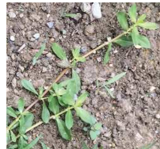
〔ナガエツルノゲイトウ〕

国から特定外来生物の指定を受けている南米原産のナガエツルノゲイトウ(以下「ナガエ」という)は繁殖力が非常に強い水草です。県内では阪神、東播磨、中播磨、淡路地域で既に侵入・繁殖が確認されています。