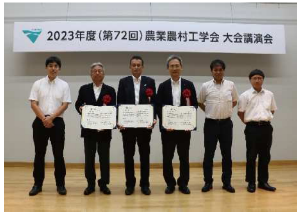
[受賞した各組織の代表者]