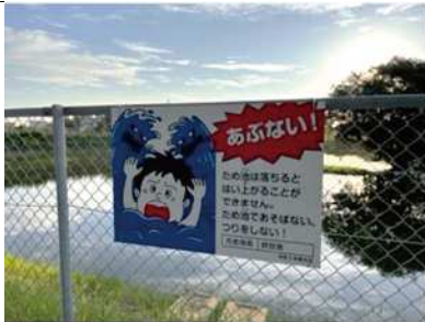
〔ため池安全啓発の看板〕