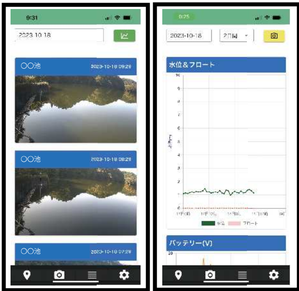
水位の変化が画像とデータで確認できる