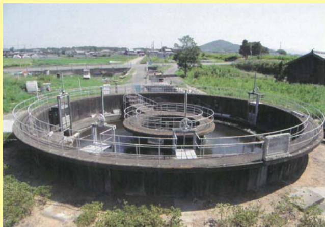
現在の練部屋分水所

現在の施設は、1959(昭和34)年に、より正確な分水が可能な鉄筋コンクリート製の円筒形に改修されたものです。配水口は統合されて、現在は四つとなっています。