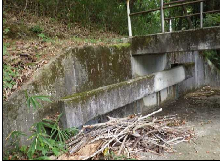
(20) 流入水路-1 遠景