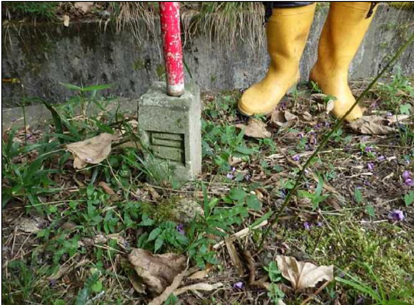
(29) 境界石 近景