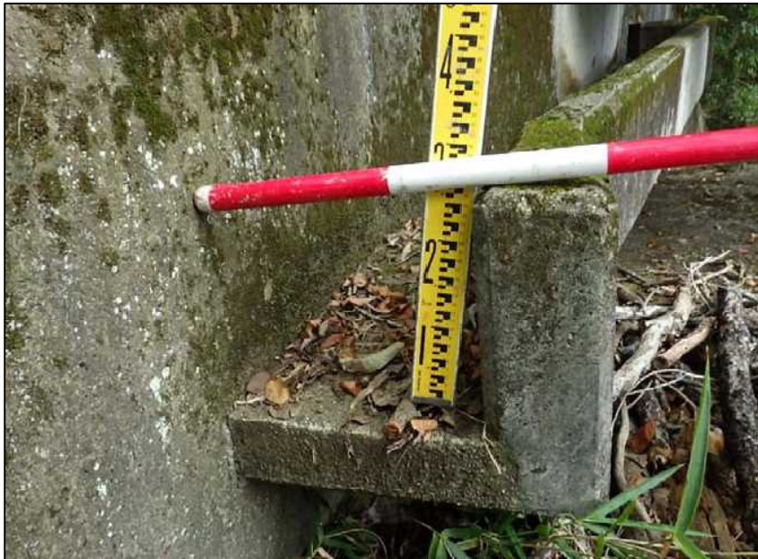
(21) 流入水路-1 近景