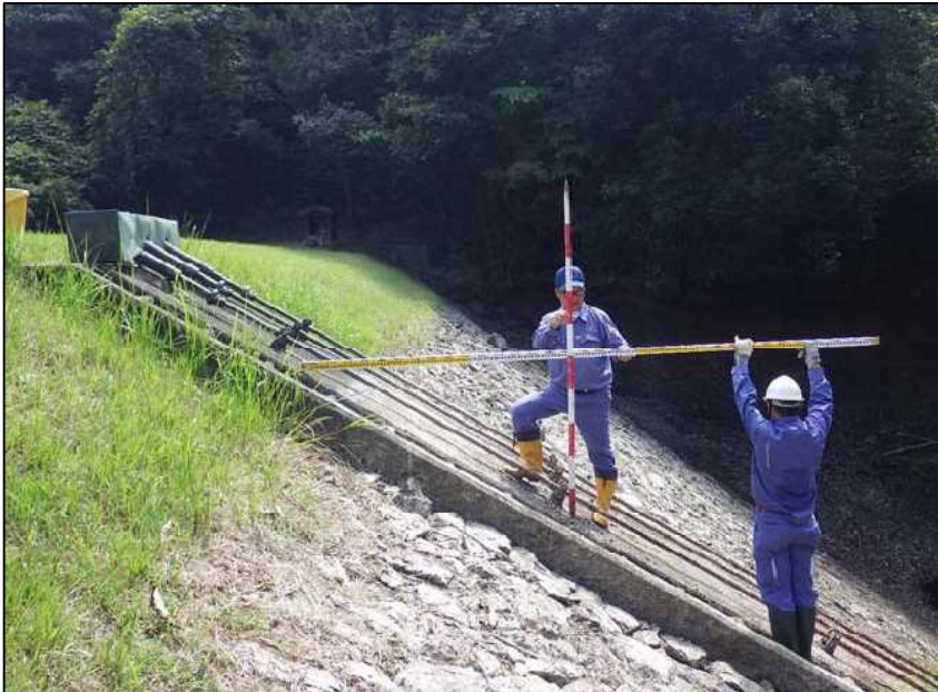
(5) 堤体前法 1:1.6