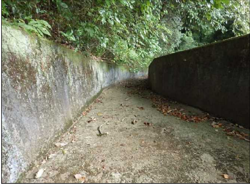
(11) 洪水吐 下流方向-1