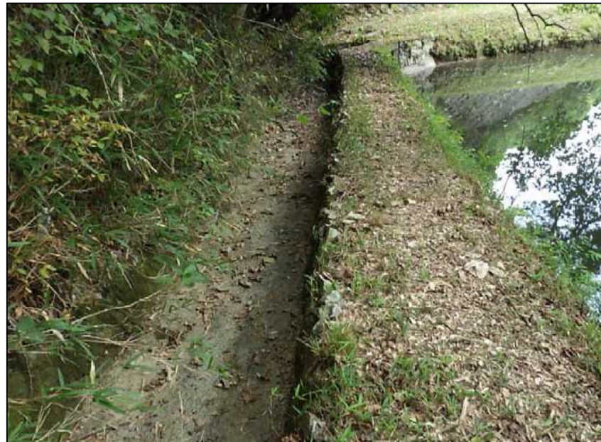
(13) 洪水吐 下流方向-3