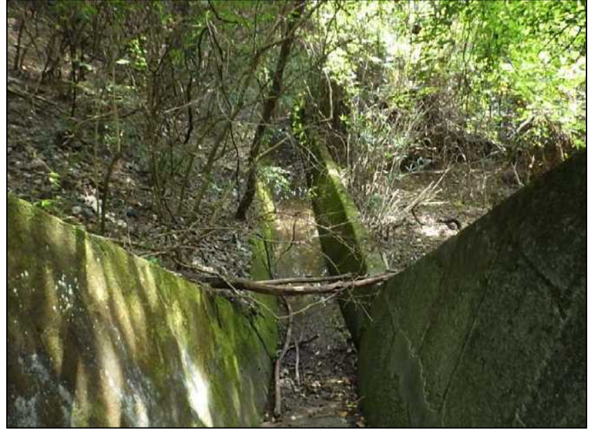
(24) 流入水路-3 遠景