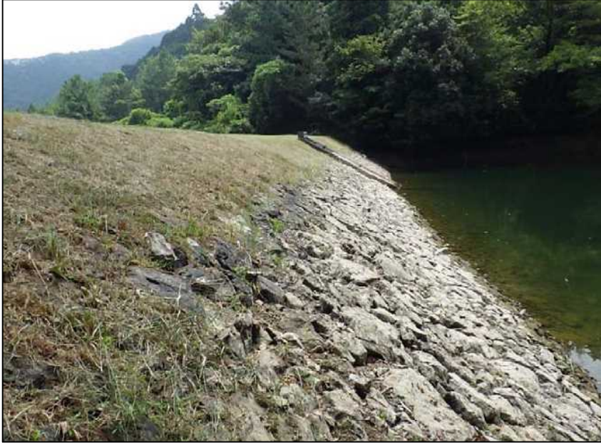
(3) 堤体前法 (全景)