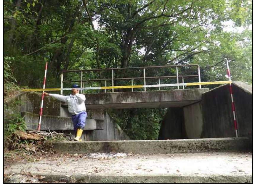
(8) 洪水吐 h=1.2\text{m} , b=4.4\text{m}