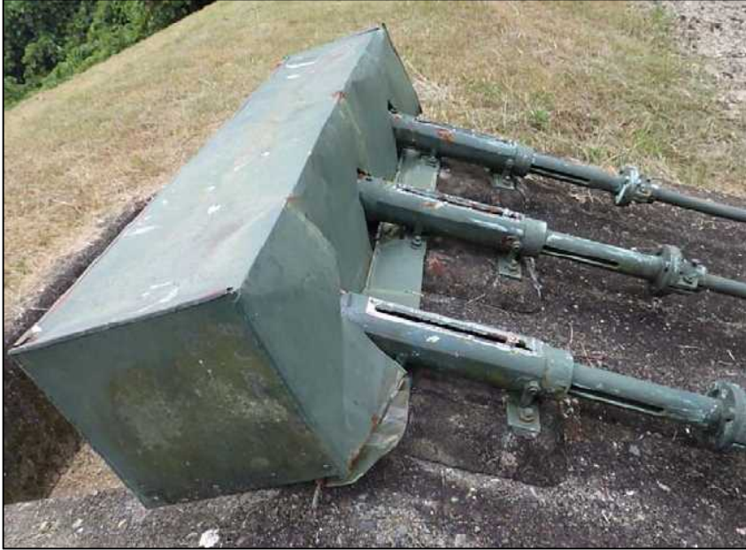
(15) 取水施設 スライドバルブφ200×2孔、φ150×1孔