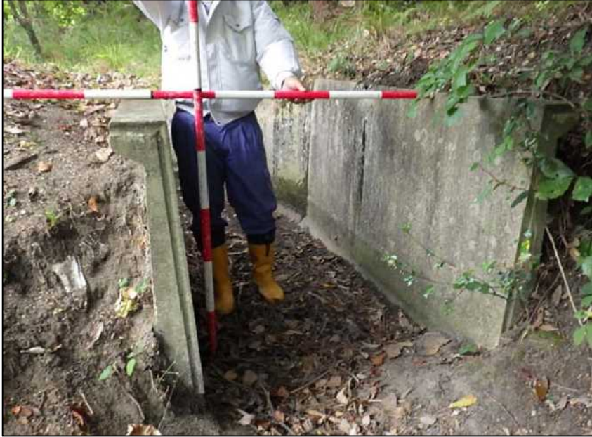
(23) 流入水路-2 近景