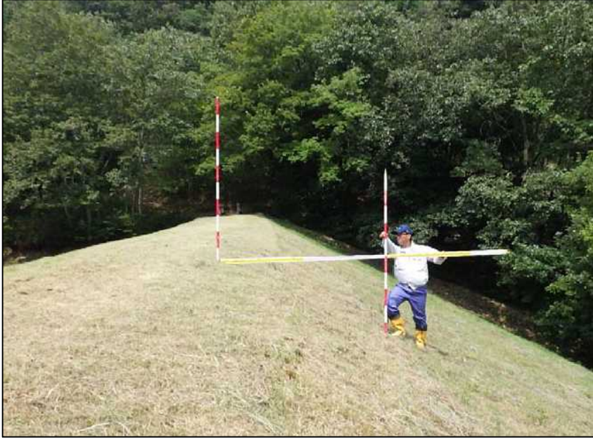
(7) 堤体後法 1:2.0