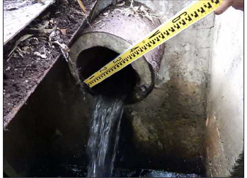
(16) 取水施設 底樋管HPφ300 近景