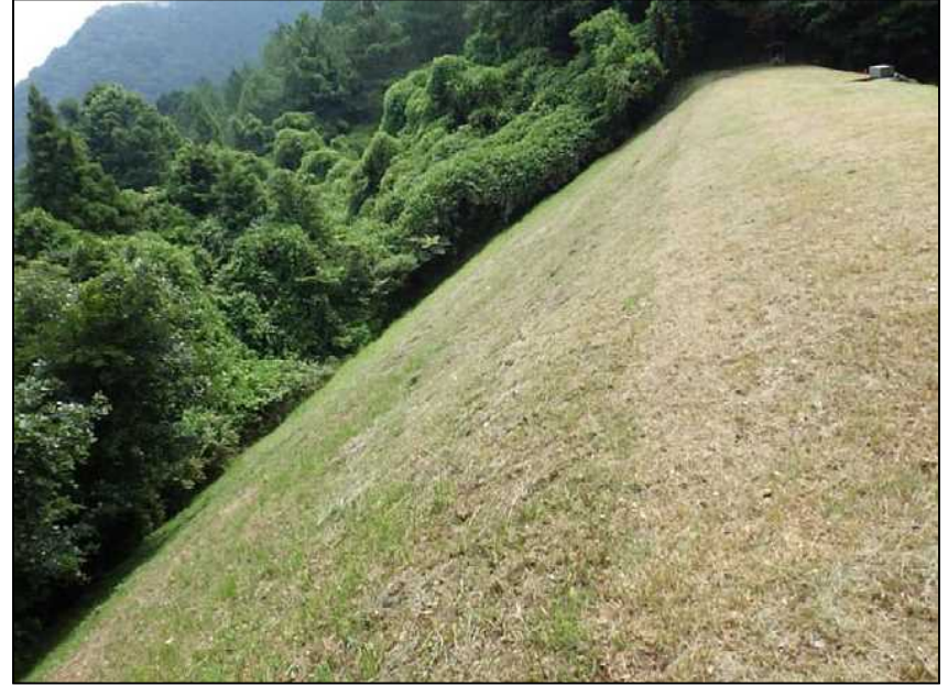
(4) 堤体後法 (全景)