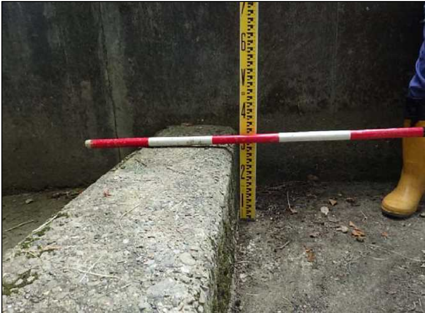
(9) 洪水吐 p=0.3\text{m}