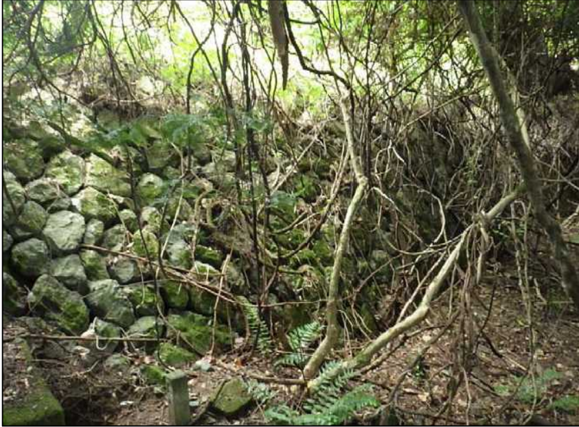
(19) 堤体下流 石積