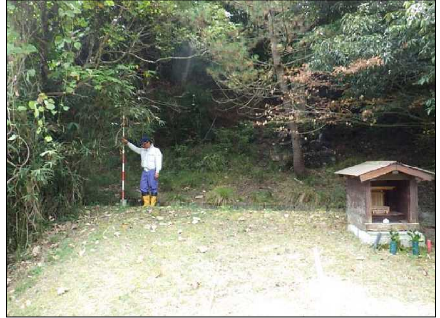
(28) 境界石 遠景