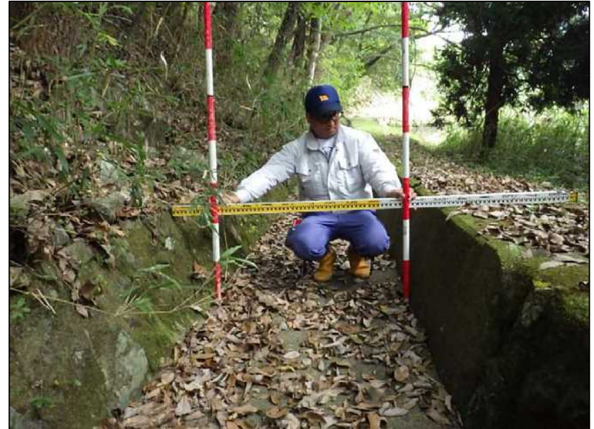
(12) 洪水吐 下流方向-2 h=0.5\text{m} , b=(1.3+0.8)/2=1.1\text{m}