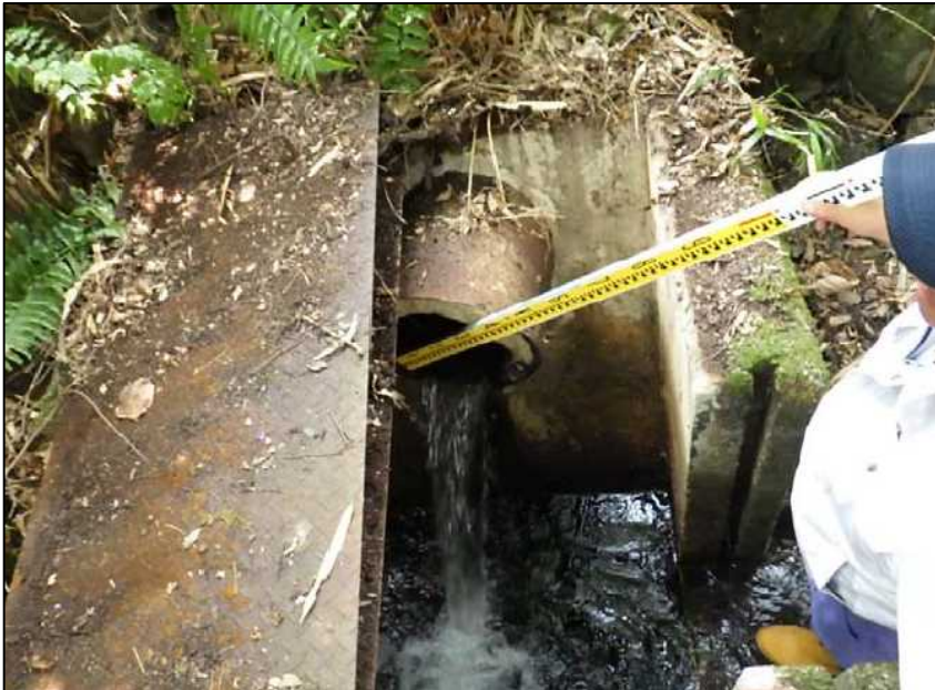
(17) 取水施設 底樋管HPφ300 遠景