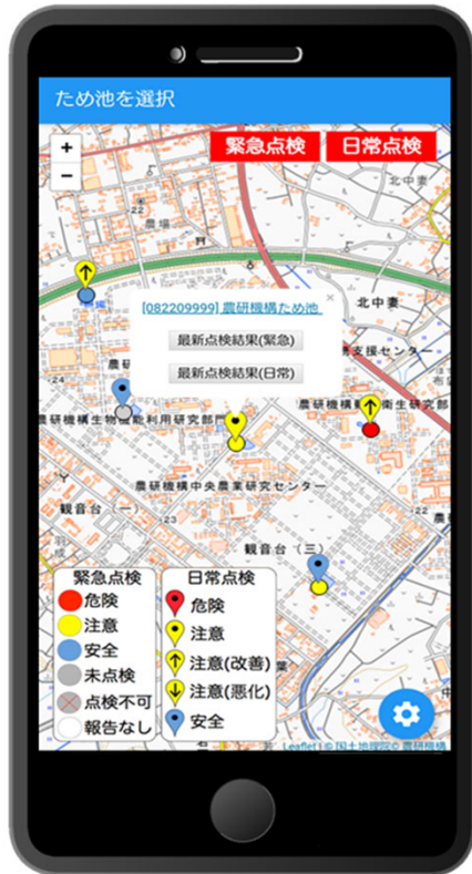
▲ 地図画面イメージ