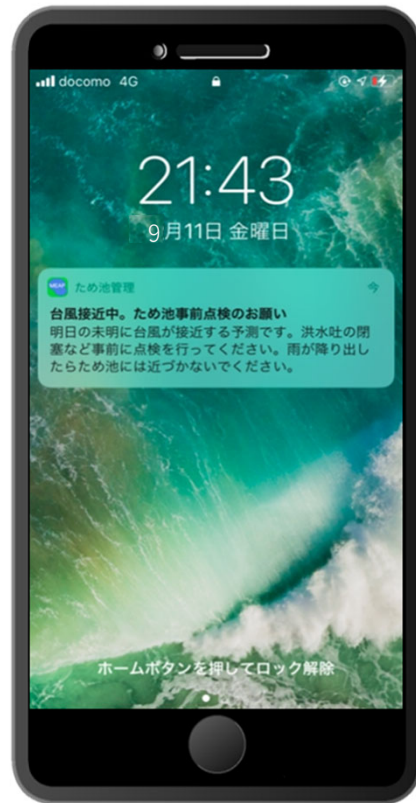
▲ プッシュ通知表示イメージ