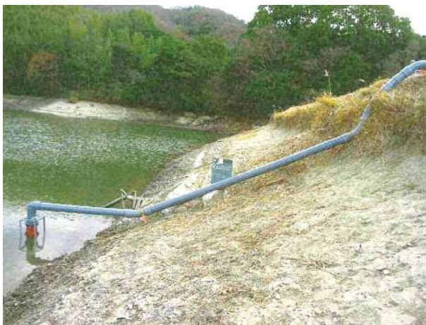
放流施設設備状況（淡路市 皿池）