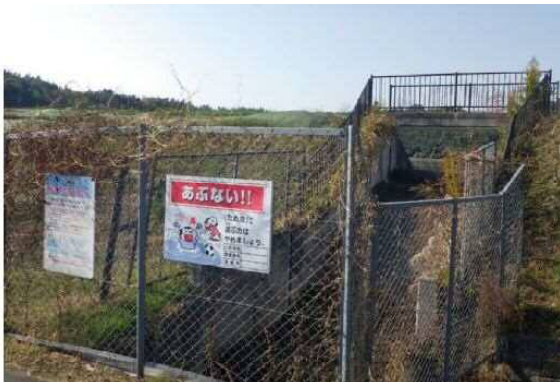
安全施設設置状況（神戸市 上津橋大池）