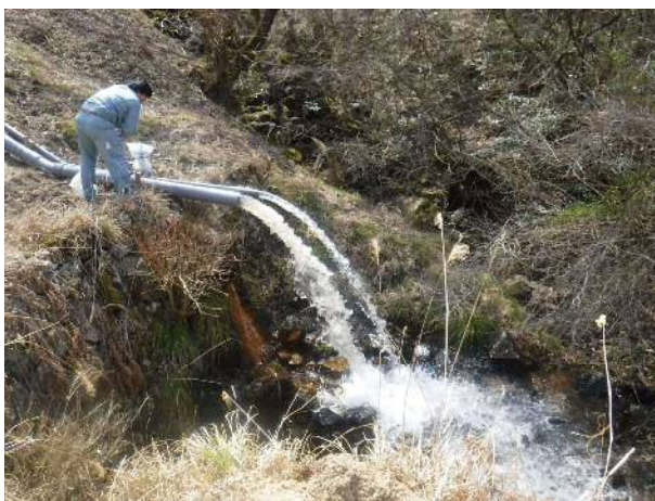
貯水位の落水状況（丹波篠山市 奥新池）