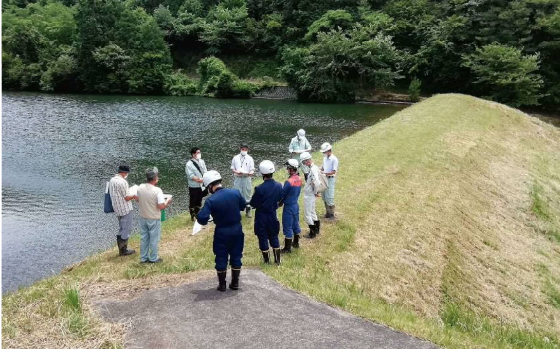
「豊かなむらを災害から守る月間」パトロール（養父市 峠下池）