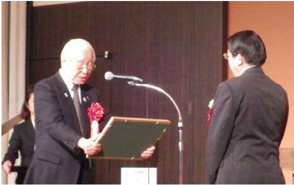
井戸知事から感謝状を贈られるため池管理者